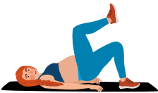
Glute Bridge March

Zungumza na daktari wako ili uhakikishe kuwa ni salama kwako kufanya mazoezi wakati wa ujauzito. Mwanamke mjamzito mwenye afya bora anapaswa kujaribu kufanya mazoezi ya takribani saa 2.5 kila wiki.